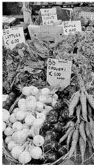
La verdura è fondamentale

FRUTTA E VERDURA. E' un'ottima abitudine comprare quantità di frutta e verdura che verranno consumate in pochi giorni e prediligere i prodotti di stagione. Lavare a fondo la verdura e la frutta con acqua fredda, permette di consumarla in sicurezza. Per pulire bene i prodotti con buccia dura e/o rugosa (mele, me-